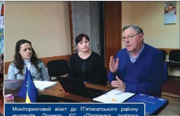
Моніторинговий візит до П'ятихатського району експертів Проекту ЄС «Підтримка політики регіонального розвитку в Україні».

Проект П'ятихатської районної ради «Розвиток молочного тваринництва і низька продуктивність сільськогосподарських ринків» №2014/345-628 у рамках проекту Європейського Союзу в особі Європейської Комісії «Підтримка політики регіонального розвитку в Україні» щодо створення сільськогосподарського обслуговуючого кооперативу (далі – СОК) по заготівлі молока з метою забезпечення розвитку молочного скотарства та впровадження ефективного ринку сільськогосподарської продукції в П'ятихатському районі.