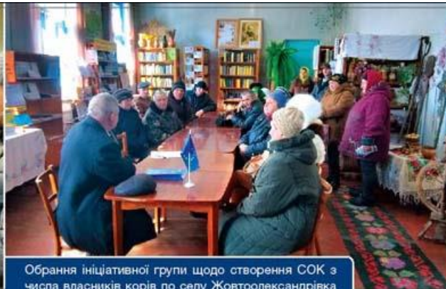
Обрання ініціативної групи щодо створення СОК з числа власників корів по селу Жовтоолександрівка Пальмирівської сільської ради.