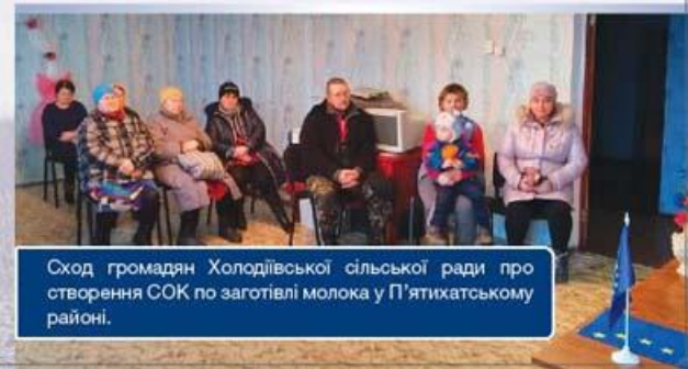
Сход громадян Холодівської сільської ради про створення СОК по заготівлі молока у П'ятихатському районі.