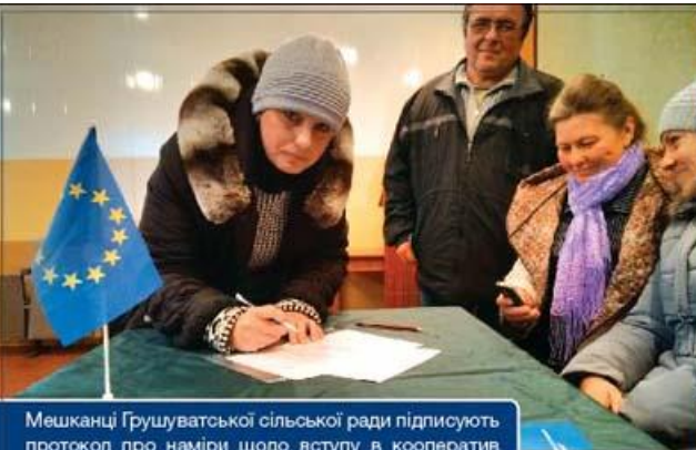
Мешканці Грушуватської сільської ради підписують протокол про наміри щодо вступу в кооператив П'ятихатського району.